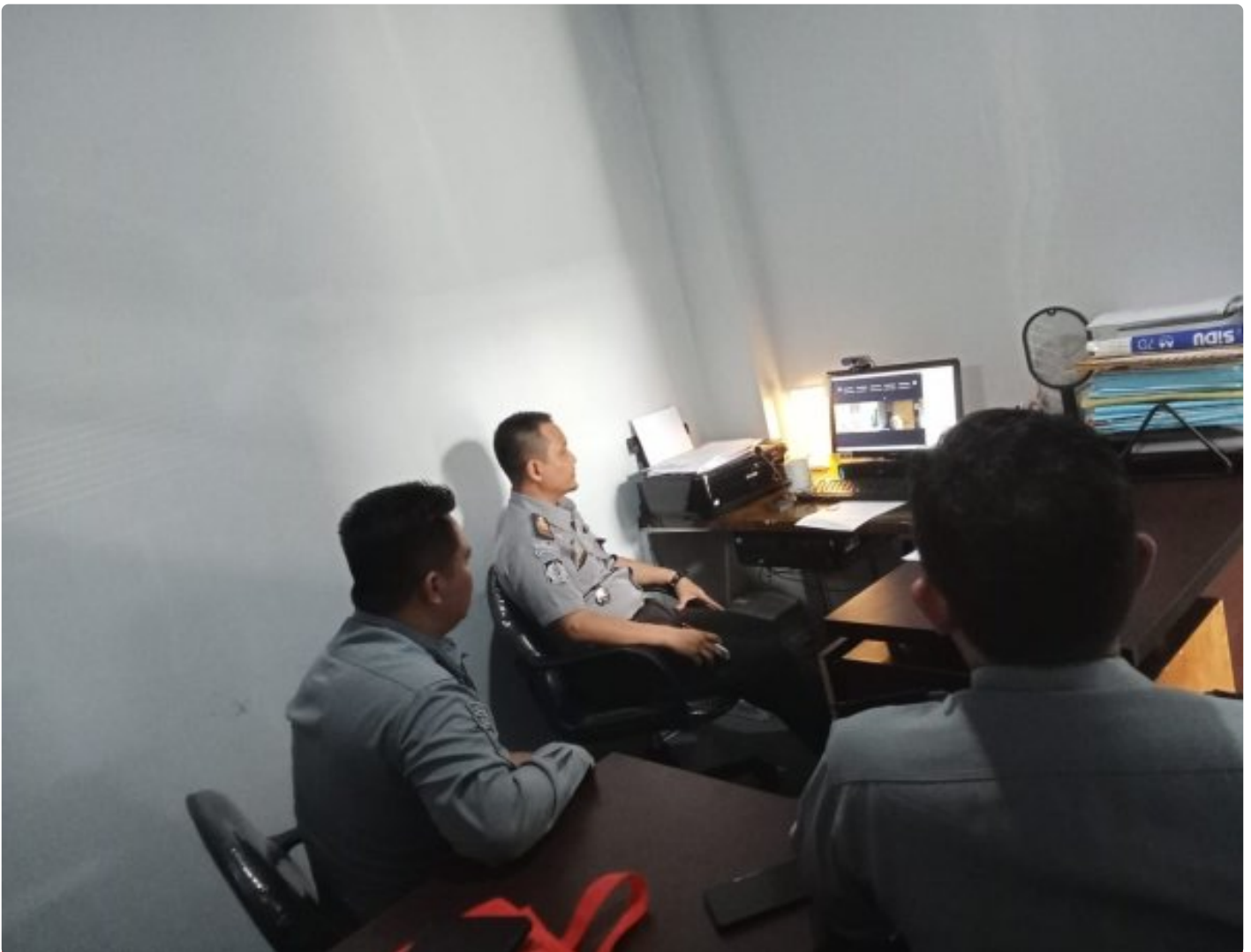
Lapas Purwokerto Ikuti Monitoring Pemenuhan RKT RB Oleh Kadivpas Kanwil Jawa Tengah

PURWOKERTO Tim Kerja Zona Integritas Lapas Kelas IIA Purwokerto mengikuti monitoring Pemenuhan Rencana Kegiatan Tahunan Reformasi Birokrasi (RKT RB) Unit Pelaksana Teknis (UPT) Pemasarakatan Kanwil